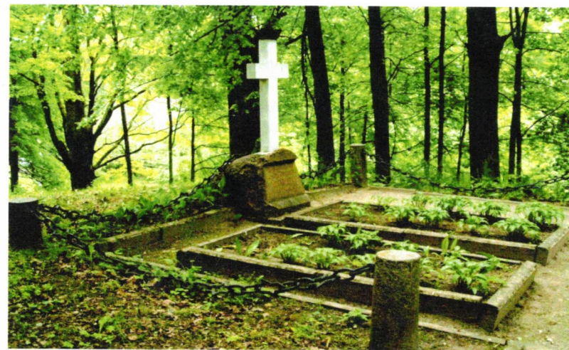
Рис. 6. Могила В. Л. Назимова (1876–1941) и Варвары Николаевны Мельниковой (1834–1910).