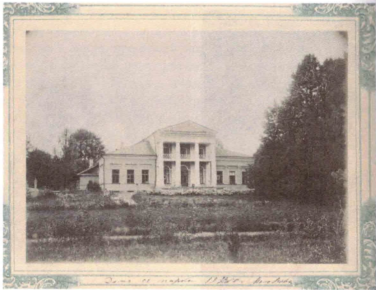
Дом и парк родовой усадьбы Бибикувых Молоково, 1910 г.