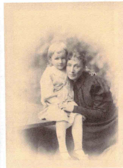
К. Е. Маковский. Портрет Варвары Дмитриевны Волковой. Фотография П. С. Демидова. Варвара Алексеевна Пушкина с внучкой Варенькой. Конец XIX в. Фотография из LPM F18 © Государственный Эрмитаж, Санкт-Петербург