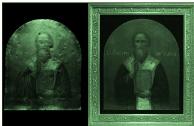
Ikona „Šv. Grigalius Nazianzietis“.

tauratorių. Ikonų būklė, nors jos buvo kruopščiai saugotos muziejaus patalpose, buvo kritinė: ikonos buvo sulankstytos, deformuotos kulų ir pažeistos korozijos.