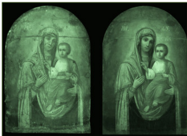
Ikona „Dievo Motina su Kūdikiu“.