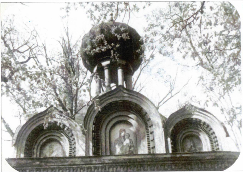
Храм до реставрации. 1985 г.