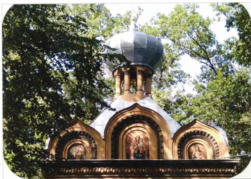
Храм после реставрации. 2019 г.