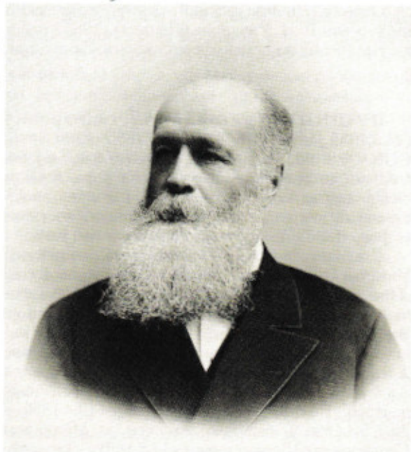
Григорий Александрович Пушкин. 1900-е гг. Вильно. Государственный музей А. С. Пушкина. Инв. № 17313

тина, с 17.4.1862 ротмистр , 25.4.1864 в чине подполковника по армейской кавалерии переведен в распоряжение Министерства внутренних дел , в 1865 вышел в отставку.