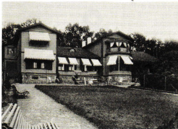
Главный дом имения Маркучай. Рубеж XIX–XX в. Литературный музей А. С. Пушкина (Вильнюс, Литва)

Назначение и обстановка 6 комнат 1-го этажа остались почти без изменения, сохранив подлинную картину быта русского дворянства кон. 19 в. В рабочем кабинете Г. А. Пушкина находится мебель, сделанная в 1884 вильнюскими мастерами: письменный стол, книжные шкафы и этажерки. Вся мебель украшена пушкинскими родовыми гербами и монограммами В. А. Пушкиной. В шкафу красного дерева хранится 21 книга из 34, изданных при жизни А. С. Пушкина. Экспозиции посвящены жизни и творчеству поэта и связям его творчества с Литвой. В гостиной стоит рояль фирмы «Беккер», изготовленный в Петербурге в 1876. На стенах в гостиной – портрет дяди В. А. Пушкиной генерал-инженера Павла Петровича Мельникова, министра путей сообщения России.